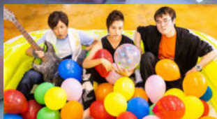
オープニング演奏 (LIBEREAL)

子育てを応援する「こどもプラザ」を開催します。子どもを真ん中にしながらも親子で楽しめるイベントやコーナーがあり、保健師による「子育て相談」もできます。